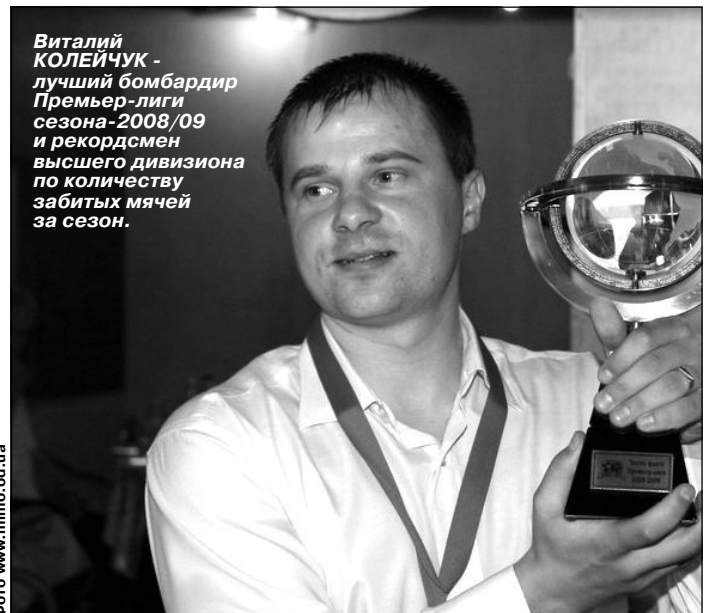
Виталий КОЛЕЙЧУК - лучший бомбардир Премьер-лиги сезона-2008/09 и рекордсмен высшего дивизиона по количеству забитых мячей за сезон.

В преддверии старта чемпионата города наставники команд Премьер-лиги ответили на вопросы «Времени Спорта»