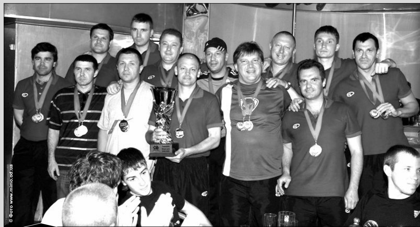
Чемпион Малой лиги-2008/09 «Черное море».

«Едність» «Сана Плюс» «Эллада» «Черное море» «Фонтан» «Кристалл» «Диадора» «Кодекс» «PRG-Юнайтед»