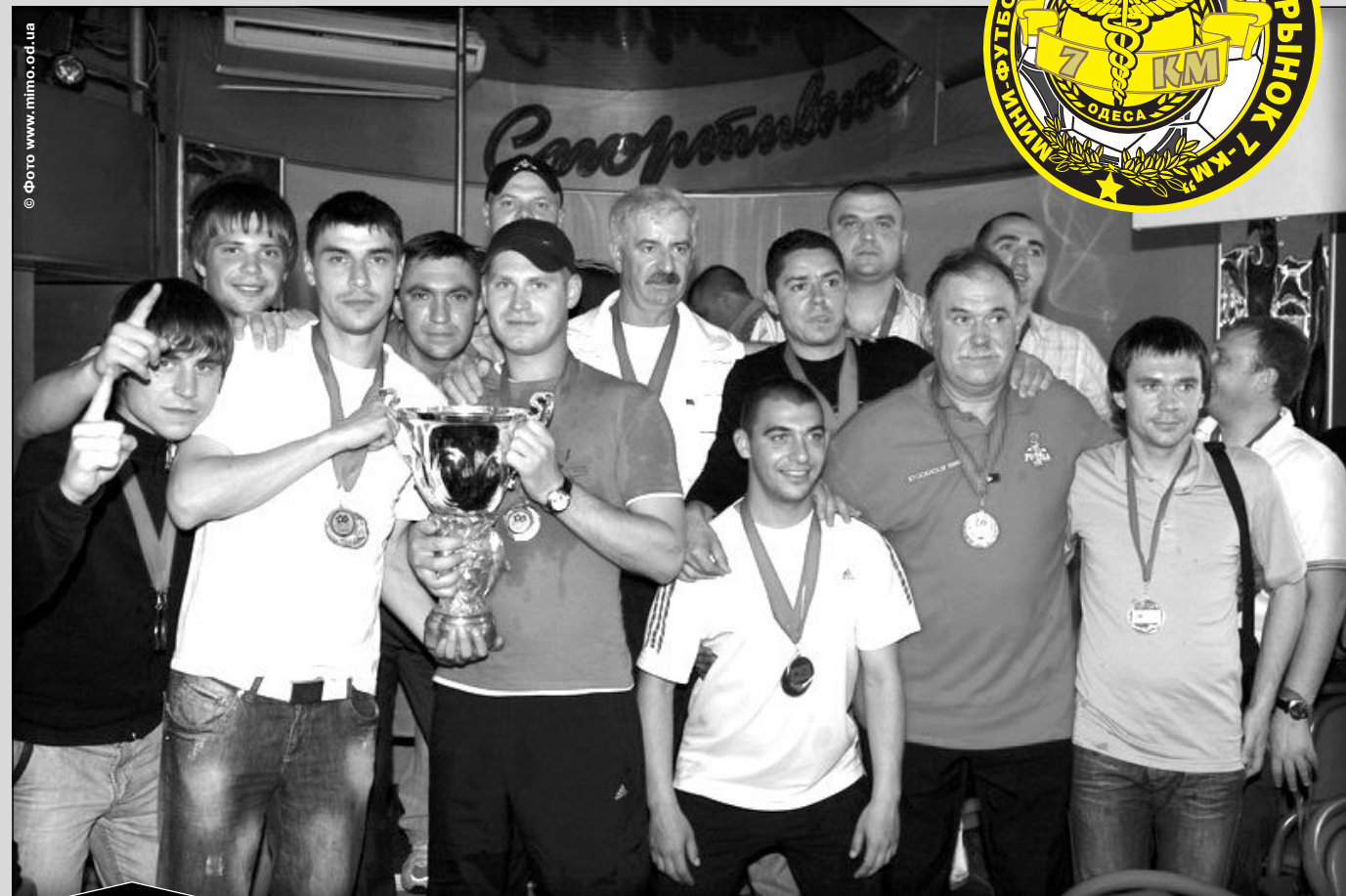
Чемпион Премьер-лиги-2008/09 «Промрынок 7 км».

«Промрынок 7 км» «Элефант-Юг» ТГО «Глобус»