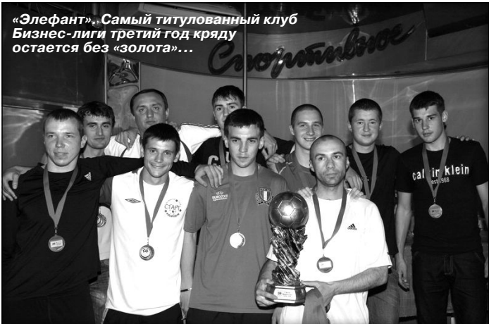
«Элефант» - Самый титулованный клуб Бизнес-лиги третий год подряд остается без «золота»...

Отказавшись от стандартного опросного листа, который традиционно заполняется банальными ответами, в этом году мы получили семь (а с «Константой» должно было быть - восемь) оригинальных мини-интервью, уже просто перечитать которые, хочется быстрее окунуться в атмосферу стартовавшего 13 сентября чемпионата города. Роль фаворитов в нем отводил командам первого квартала по итогам сезона-2008/09. Представители всех четырех команд практически безапелляционно утверждают свое право на чемпионский титул, и хотя многие делают обязательные оговорки на стандартные трудности. И это не может не радовать, ведь с таким уровнем конкуренции страсти на паркету СКА будут бушевать нешуточные. Как нетрудно догадаться, одной из главных составляющих успеха станет способность набирать очки в матчах с остальными участниками чемпионата, которых, между тем, не стоит сбрасывать со счетов. А каждому из них есть что доказывать и себе, и людям.