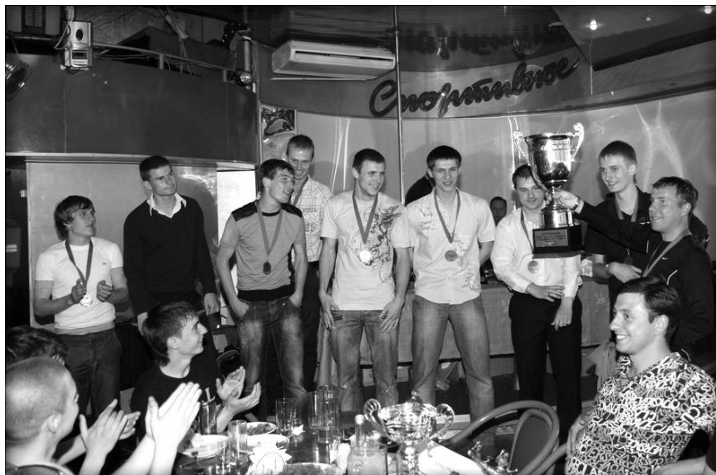
Вслед за утешительным призом «Гроза авторитетов» по итогам чемпионата города «Глобус» добыл свой первый полноценный титул, став обладателем Кубка Одессы.