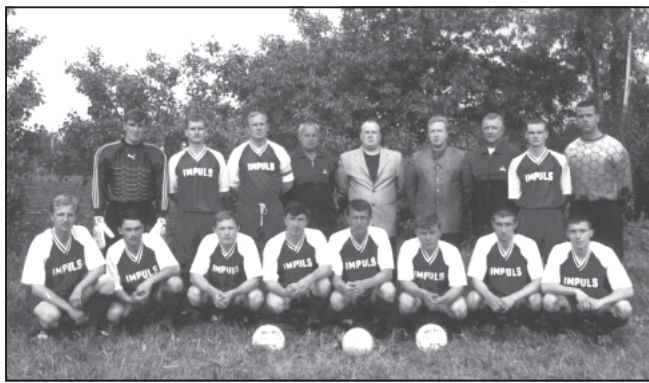
ФК «ИМПУЛЬС» (Пуужайково) — один из фаворитов первенства области среди команд первой лиги