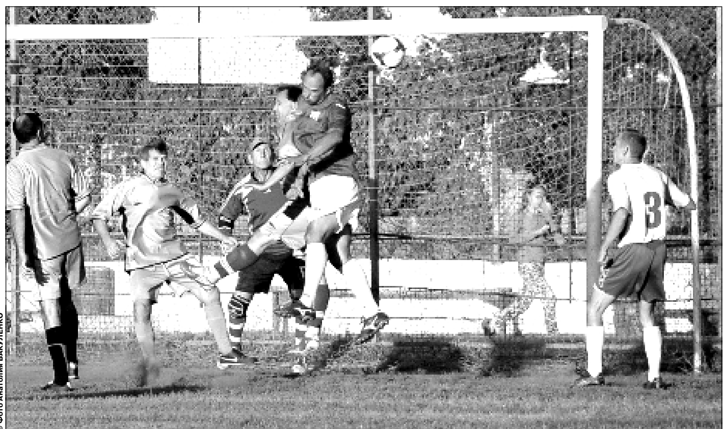
19 сентября. Одесса. Стадион «Краян». «Автомобилист» - «Таврия В» - 2:2. В этой встрече преваляла рекордная победная серия «Таврии В», составившая в итоге 19 матчей.