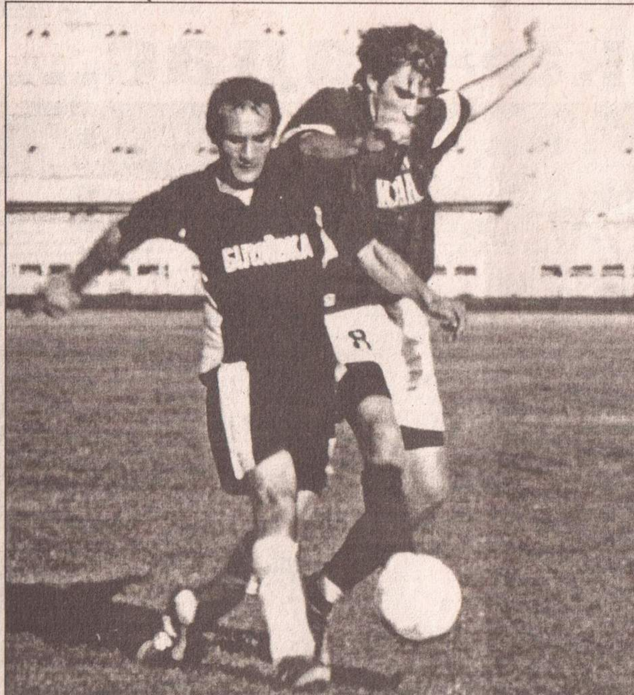
Никто не хотел уступить...