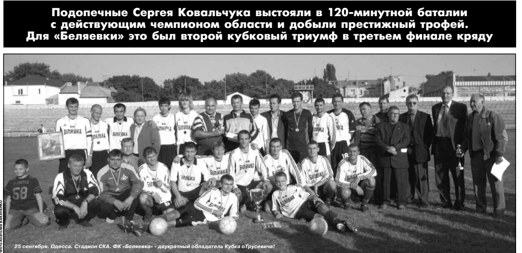
25 сентября. Одесса. Стадион СКА. ФК «Беляевка» - двукратный обладатель Кубка Трусевича!