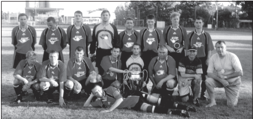
«СИГНАЛ» после блестящей победы на Международном турнире полицейских сил в итальянской Равенне