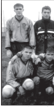
Новый чемпион Одесской области — «ТИРАС-2500» (Белгород-Днестровский)