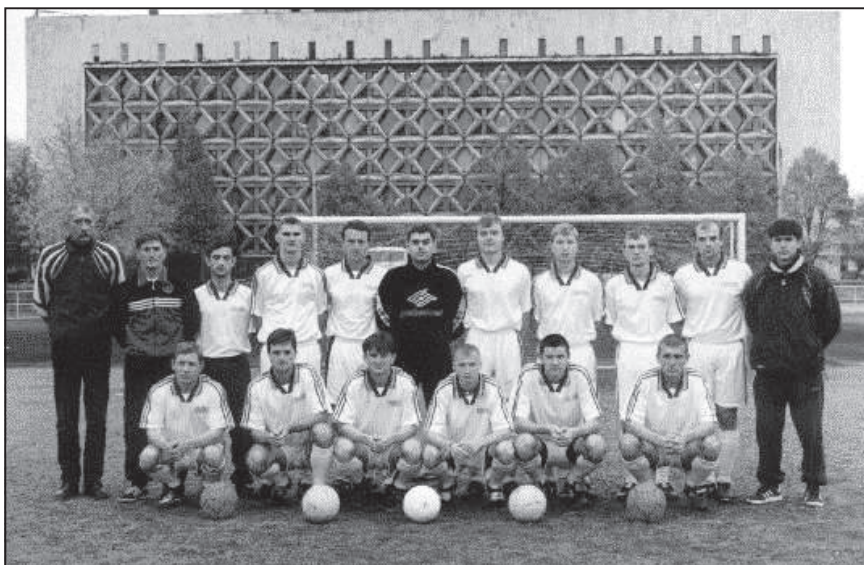
Трехкратный обладатель бронзовых медалей – великомихайловский «Атлетик»