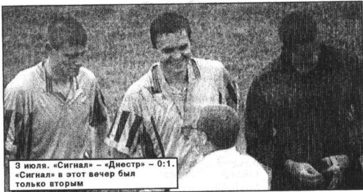
3 июля. «Сигнал» – «Днепр» – 0:1. «Сигнал» в этот вечер был только вторым