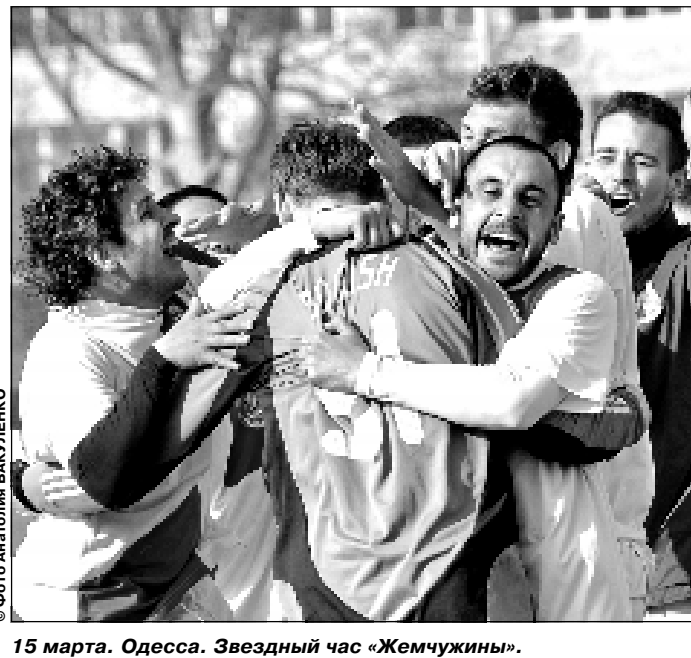
15 марта. Одесса. Звездный час «Жемчужины».