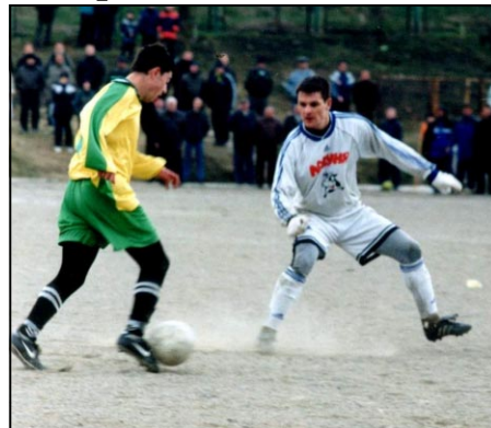
Финальный матч «Солнечная Долина» – «Ласуныя» стал настоящим украшением первенства

В первом тайме «Ласуныя» могла увеличить счет на табло, но на последнем рубеже уверенно действовал Степанов. А вот в атаке «долинцы» не создали ничего путного. На