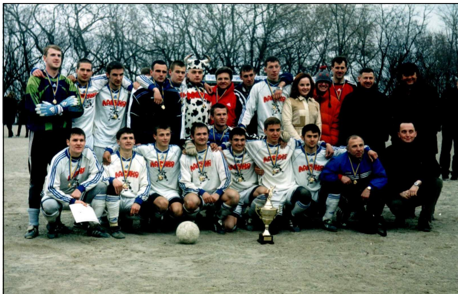
«ЛАСУНЯ» стала трехкратной победительницей зимнего первенства Одессы