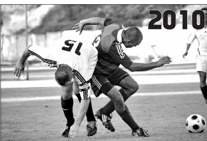
«Люксеон» - «Солнечная Долина». Один из самых упорных и зрелищных второсентябрьских финалов Кубка города.