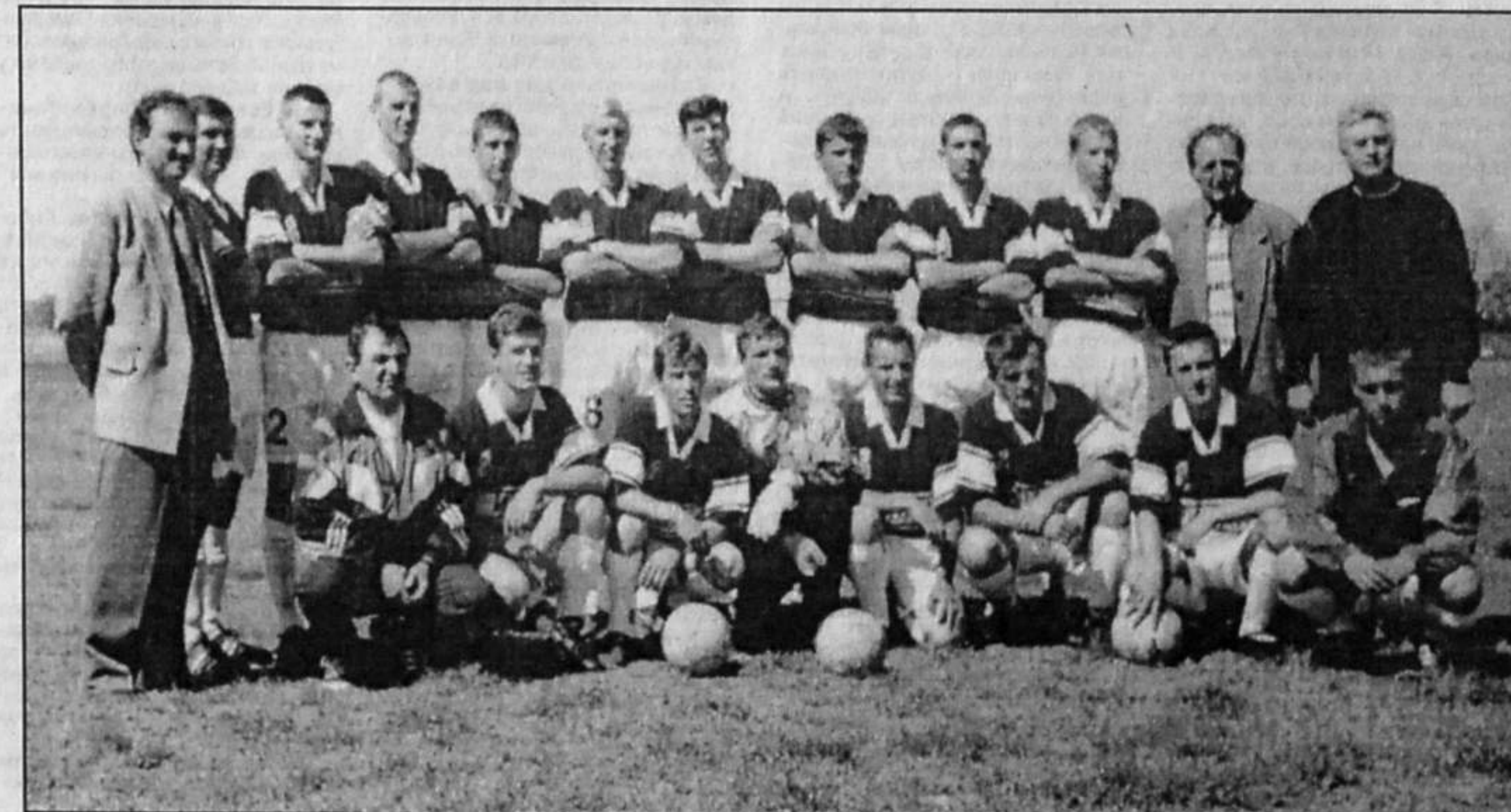
ФК «ИВАН» — народная команда Одессы