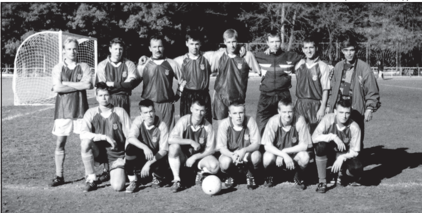
«ФАР-Аргунь» – в новый сезон с новыми надеждами...

– Как боеспособный коллектив, который способен добиваться серьезных результатов как минимум на уровне городской лиги. А дальнейших планов пока можно только мечтать. И все-таки я верю, что у команды хорошее будущее.