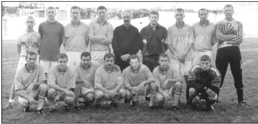
«СИНТЕЗ» — не в профессионализме дело, а в любви к футболу...