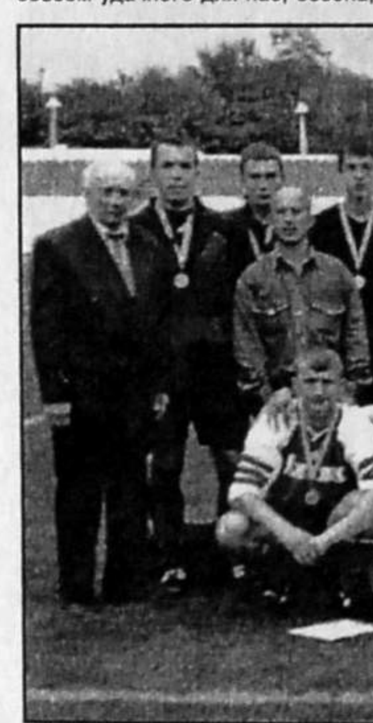
Впервые в своей истории «ИРИК» покорил золотые вершины чемпионата и Кубка Одессы