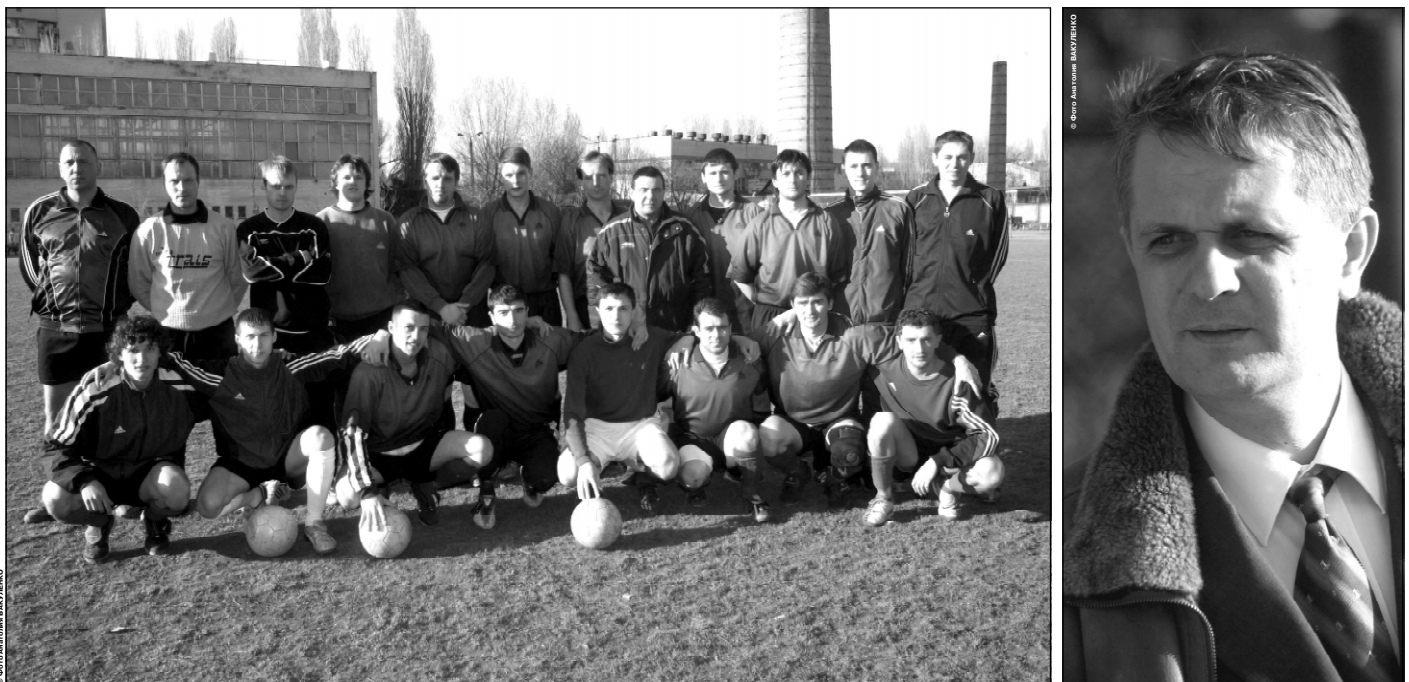
7 апреля 2005 года. Стадион Политехнического университета. ФК «Фонтан-Портовик» перед последним спаррингом межсезонья с зимним чемпионом Одессы «Солнечной Долиной», в котором ильичевцы праздновали победу - 4:2.

ку и научинась дышать полной грудью. Собственно, мы ведь к такому переходу и готовимся. Есть еще, правда, еще один аспект - техника владения мячом. В мини-футболе и в уличном свежим воздухом, в зале тебе этого самого воздуха, что вполне естественно, будет сильно не хватать. Иное дело, когда из зала выходить на ули-