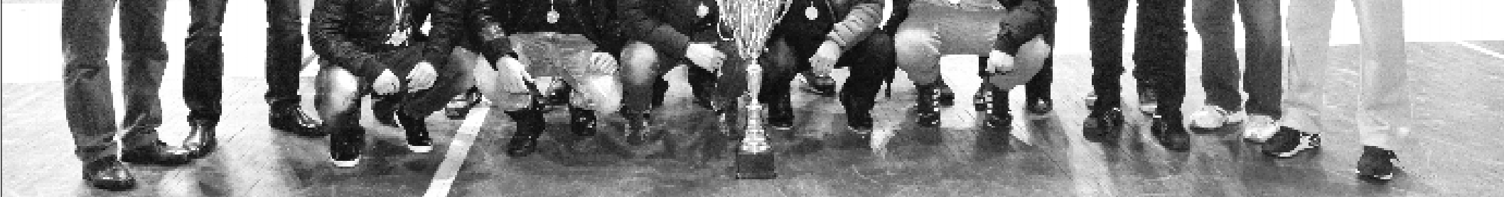
26 ноября, Одесса. УЗС «Кривин». Тренеры и футболисты «Атлетика» во время церемонии награждения золотыми медалями...