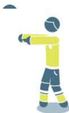
Удар от ворот